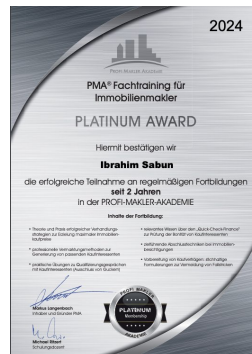
Platinum Award 2024 Ibrahim Sabun