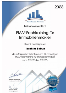
PMA® Fachtraining Ibrahim Sabun 2023