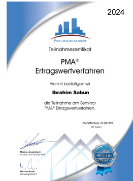
PMA® Ertragswert- verfahren 2024