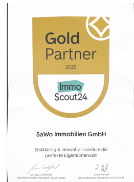
Gold Partner ImmoScout24 2025